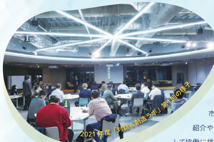
2021年度「対話&創造ラボ」第1回の様子