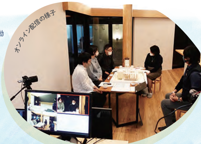
オンライン配信の様子

2020年度は新型コロナウイルス感染症の影響に伴う「市民公益活動緊急支援助成金」の交付事業を実施し、オンラインによるコミュニケーションツールの導入や衛生管理対策の充実、中間支援組織が行う他の団体への支援のサポートを行いました。2021年度は「ポストコロナにおける活動に向けたNPO法人・市民活動団体アンケート調査」を実施。今後、必要な仕組みづくりや支援等について検討していきます。